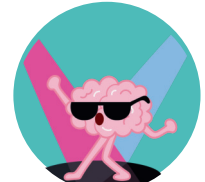
Discapacidades intelectuales o del desarrollo