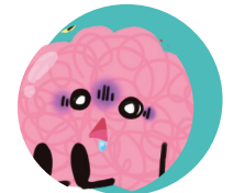
Severe substance use disorders