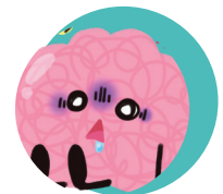
Trastornos graves por consumo de sustancias